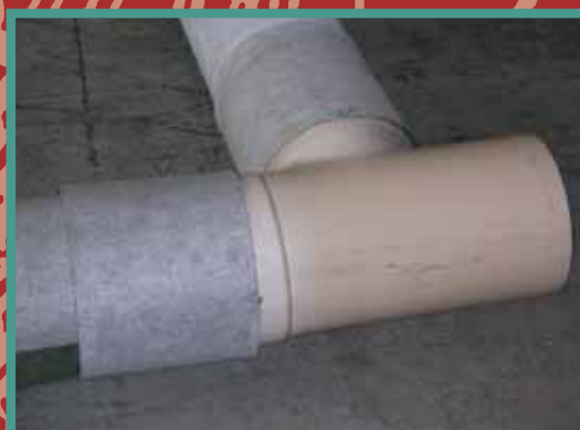
Il collegamento degli elementi con braghe e curve in PVC