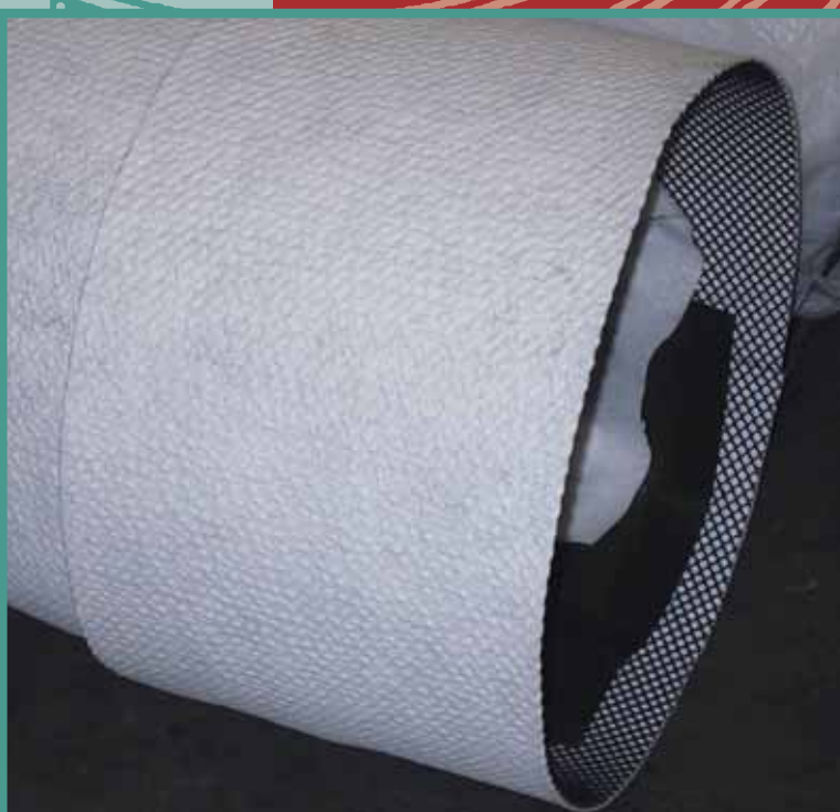
Un particolare del manicotto di giunzione