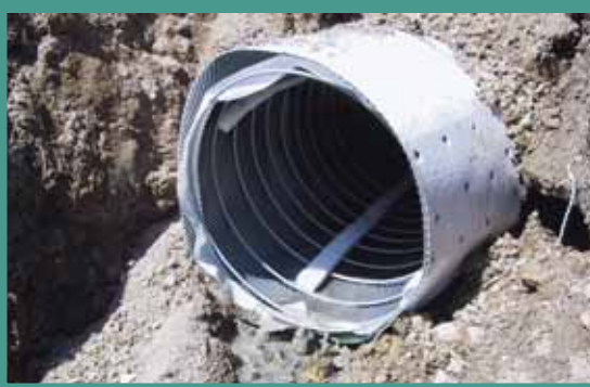
Lo SPIRODREN nello scavo